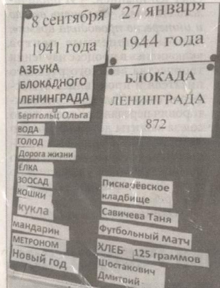
«Азбука блокадного Ленинграда» пополнилась новыми символами.

А завершилось школьное мероприятие обсуждением рассказа «Кукла». К слову, автор и этого произведения, щадя своего юного читателя, не описывает подробности тогдашнего ленинградского быта, укрывает от ужасов войны, как делают это и взрослые персонажи книги – мама, бабушка, дедушка. Весь рассказ у читателей теплится надежда: вот-вот девочка, главная героиня рассказа, и ее любимая кукла, оставленная в блокадном Ленинграде, встретятся. Но история заканчивается все же грустно. Нет, не встретятся... Финал горький, признали ребята. И все же каждый почувствовал, что эта тяжелая потеря не сломит маленькую героиню, она сумеет устоять. Так же, как сумели устоять в блокаду