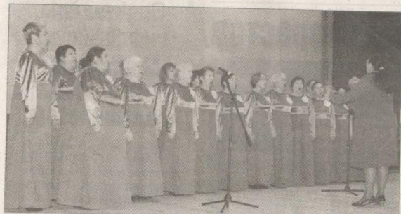
«Ты же выжил, солдат, хоть сто раз умирал!». На сцене — хор академической песни «Гармония».

страшно. Но мы верим, что сила в правде. Русский народ крепок духом. А песня помогала всегда. Думаю, что и сегодняшние вы-