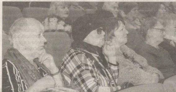
Выступления участников никого не оставили равнодушным.